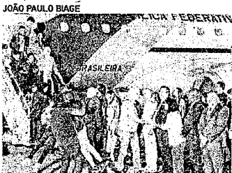
CHEGADA de avião com refugiados de Gaza