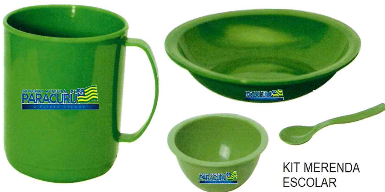
KIT MERENDA ESCOLAR