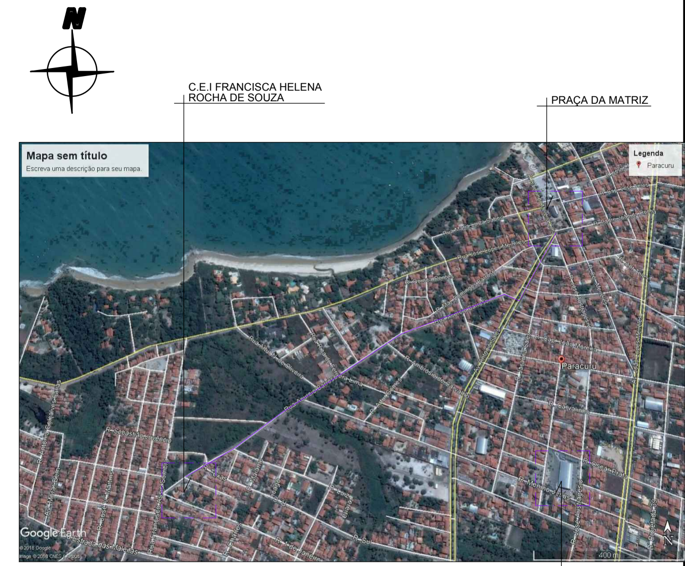
01 PLANTA DE LOCALIZAÇÃO SEM ESCALA