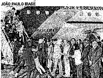
CHEGADA de avião com refugiados de Gaza